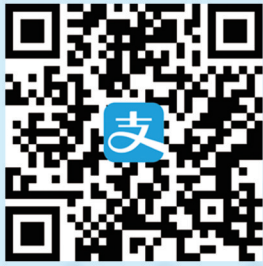
支付宝扫描二维码 或 支付宝内搜索“医保码”