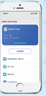
07设置密码,激活成功