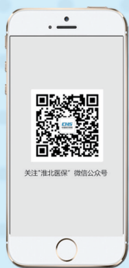
01关注“淮北医保”微信公众号