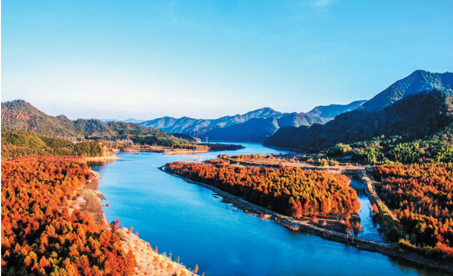
山河秋色浓

特别是晚高峰，从批发市场方向过来的电动车，乌压压一片。我哨子吹得当当响，汗水像小蚰蚴一样，顺着后背往下走。突然一阵风从背后吹过来，顿时感觉好舒服啊。我