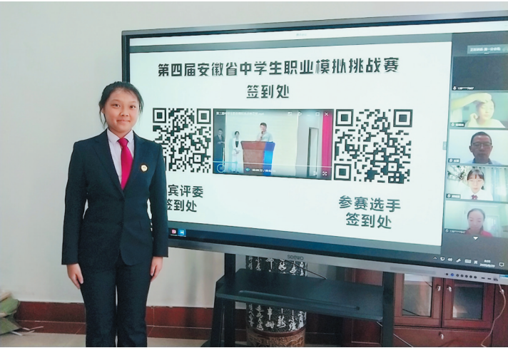
淮北一中学子参加全省中学生职业模拟挑战赛并取得优异成绩。

理念统筹创新学校的德育活动、校本课程和课堂教学,探索出一整套行之有效的教育策略,该校也成为中国教育发展战略学会生涯专委会常务理事单位、全国生涯教育实验学校。