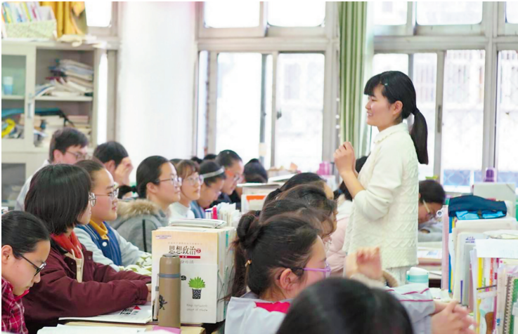
中心教师开设高三心理健康教育活动课。