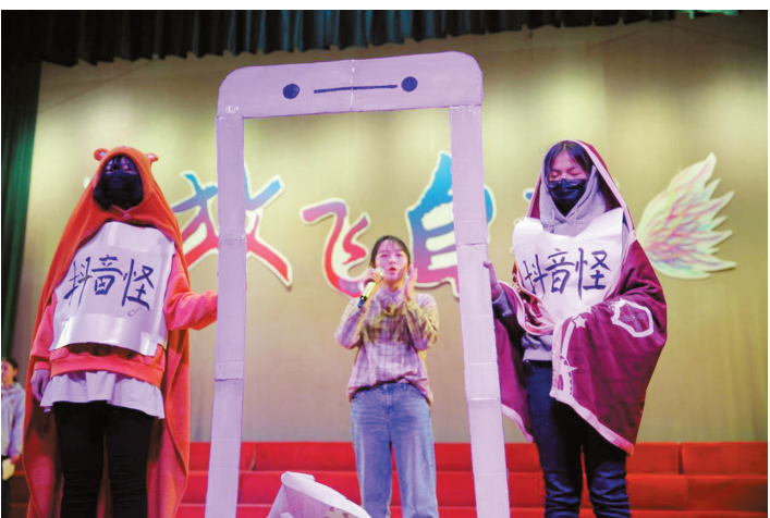
校园心理剧大赛中,学生们以艺术形式将生活和学习中的问题展现出来。