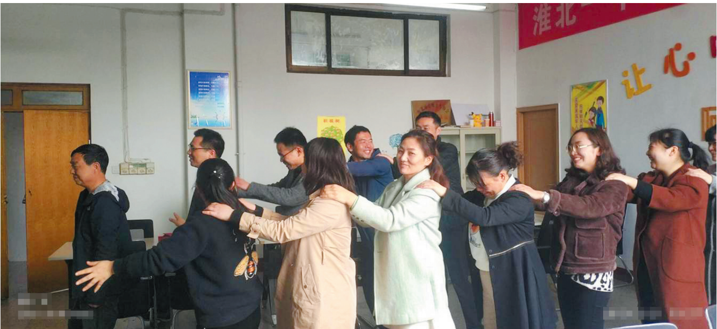
中心开展学校教师团体心理辅导活动。

关于未来,每一步的计划、每一项工作的意义,都让中心全体教师感觉任重道远。使命催人奋进,此刻,他们正不懈努力、砥砺前行!