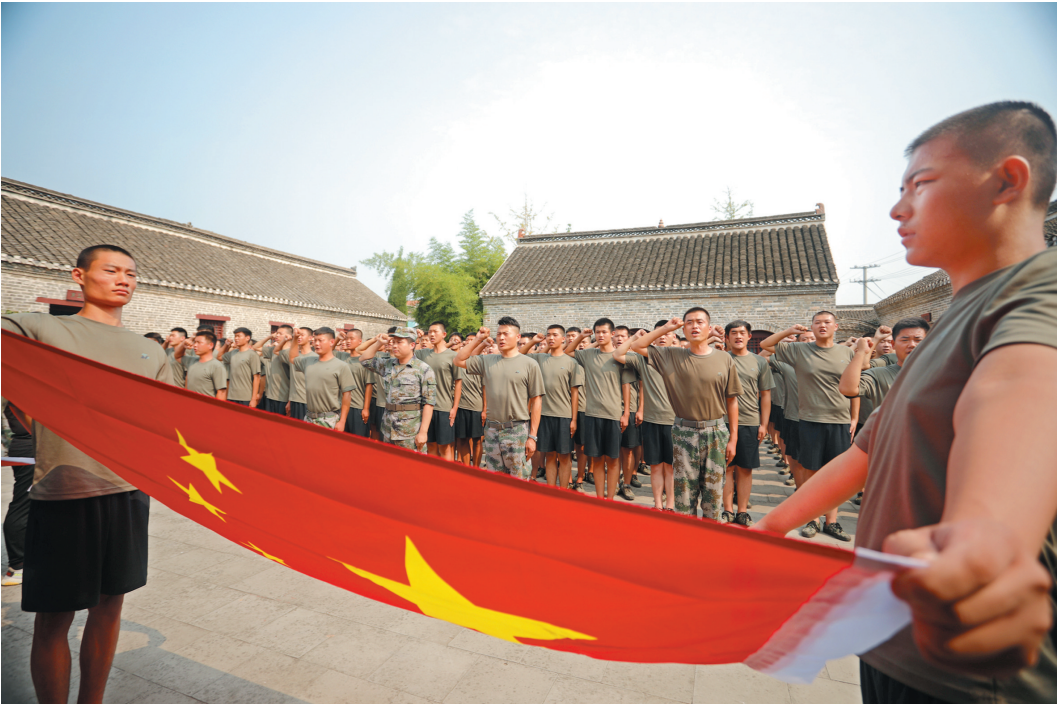
潍溪预备役人员在淮海战役总前委旧址临澳文昌宫宣誓。

“国无防不立,民无兵不安。”潍溪县委、县政府长期以来把双拥工作提高到巩固国防、维护稳定的战略高度来推进,并纳入经济社会发展和军队建设规划。专门成立以县委书记为组长的双拥工作领导小组,镇及各成员单位也都成立相应组织,进一步加强对双拥工作的领导。同时,制定《潍溪县双拥工作制度》《潍溪县双拥工作领导小组职责》等系列