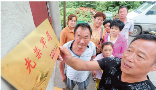
潍溪县制作光荣牌悬挂到军属家中。

潍溪县委、县政府当好子弟兵的坚强后盾,为他们排忧解难。每逢春节、八一等重要节点,县领导