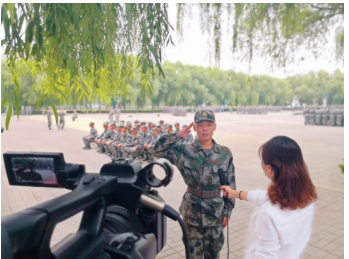
潍溪籍新兵接受家乡媒体采访。