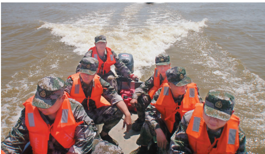
潍溪民兵预备役人员参加抗洪抢险。