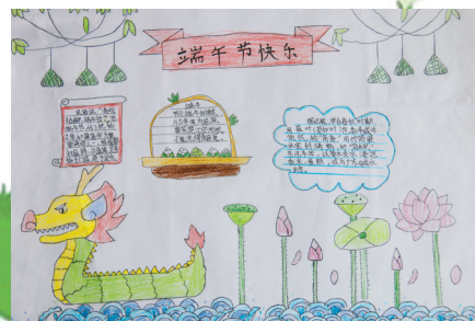
淮纺路小学 黄紫彤 指导老师:姜秀梅