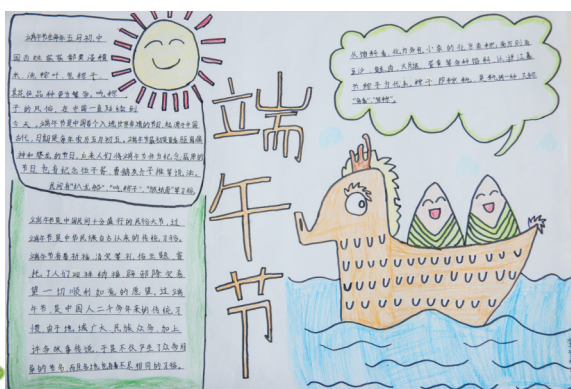
淮纺路小学 李紫妍 指导老师:关磊