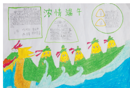
淮纺路小学 刘洋 指导老师:关磊