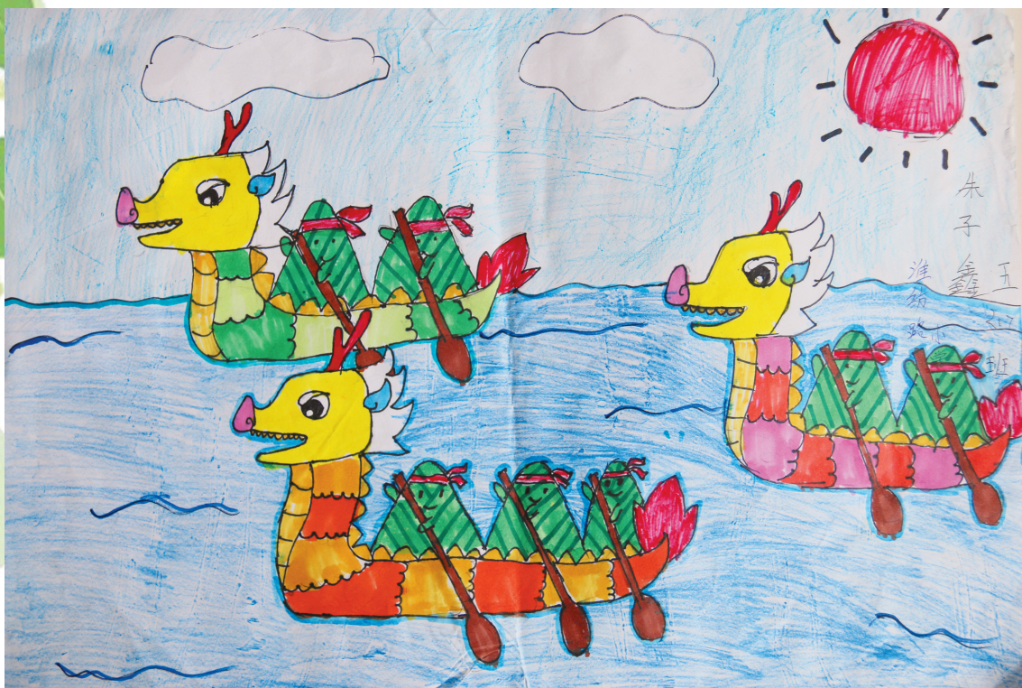
淮纺路小学 朱子鑫 指导老师:曹华丽