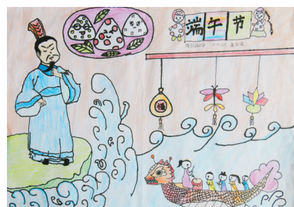
淮纺路小学 聂妙茜 指导老师:王爱琴