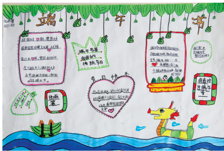
淮纺路小学 任雨菁 指导老师:常曼丽