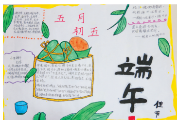
淮纺路小学 冯静轩 指导老师:姜秀梅