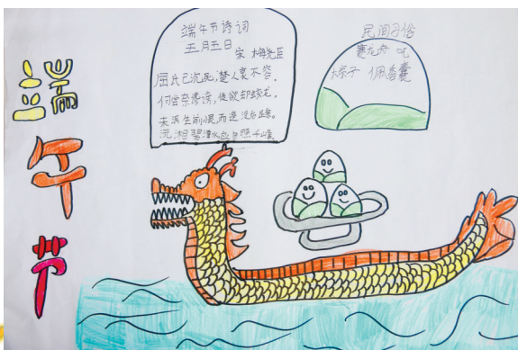
淮纺路小学 刘宸逸 指导老师:姜秀梅