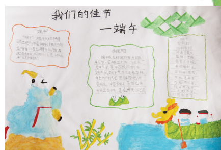
淮纺路小学 居然然 指导老师:关磊