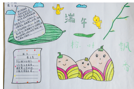
淮纺路小学 戴文迪 指导老师:邹晓茜