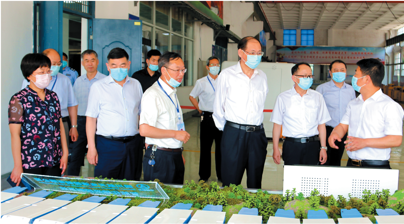
调研组在淮北煤电技师学院调研。

5月22日上午，调研组来到淮北师范大学，考察该校大学生创新创业实践基地建设情况，并详细听取今年应届毕业生就业情况介绍；随后，调研组来到淮北煤电技师学院，调研了解学院开学前疫情防控准备和工匠大