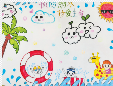
淮海路小学小记者 刘泓麟 指导老师:陈永胜