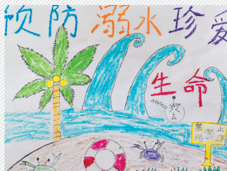
淮海路小学小记者 张宇诺 指导老师:李沛