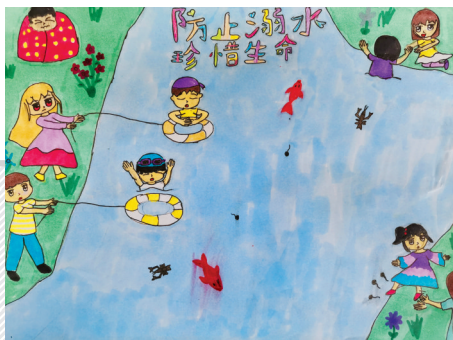
淮海路小学小记者 胡欣蕊 指导老师:李沛