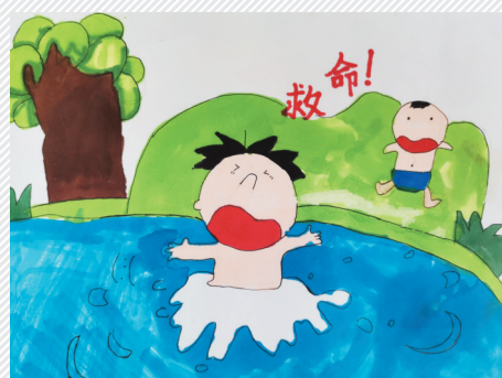
淮海路小学小记者 白曦宸 指导老师:陈永胜