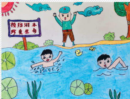
淮海路小学小记者 邵宇轩 指导老师:陈永胜