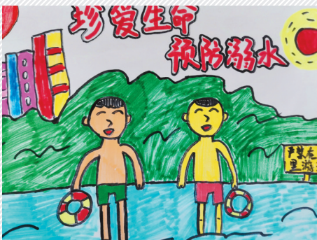
淮海路小学小记者 甘承泽 指导老师:李沛