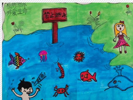
淮海路小学小记者 高睿泽 指导老师:陈永胜