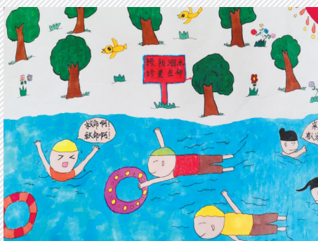
淮海路小学小记者 袁仲雪 指导老师:陈永胜