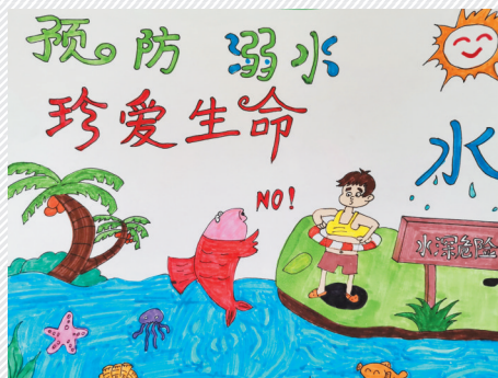
淮海路小学小记者 徐子淇 指导老师:陈永胜