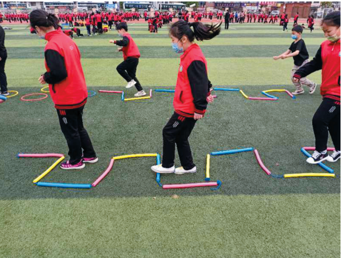
濉溪县第一实验学校学生进行阳光大课间活动。

开展督查,确保体育教育工作落到实处。建立局机关划片包片负责制,将中小学体育教育纳入督导内容及学校年度考核内容,坚持定期开展专项督导检查,通过开学检查、日常督查和专项督导等措施,督促学校严格执行国家课程设置标准,切实开足开齐体育课程,其中高中每周2课时,初中小学每周不少于3课时。全县中小学校在每天上午第二节课后安排40分钟的时间组织全校学生进行体育活动,各中小学以校园集体舞、跑步、广播操、健身操、跳绳、踢毽子、跳皮筋、打陀螺、滚铁环等民俗