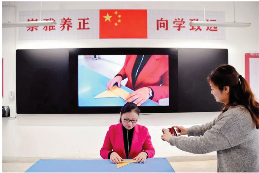
市第一实验小学智慧课堂直播培训。

人数500名以下学校配1名、500至1000名的学校配2名、1000名以上学校配3名的标准,足额配备信息技术教师,每年招聘一定比例的信息技术专业教师充实到教学一线,建设高素质的学校信息化骨干教师队伍。