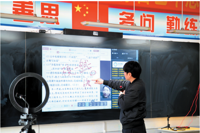
疫情防控期间濉溪县实验中学教师在线教学。

教师队伍有保障。在全市中小学设立由校领导或专职人员担任的首席信息官。按照在校学生