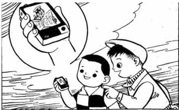
16 小虎子掏出一个小盒子似的东西给我看。原来这是一个微型的半导体电视电话机，盒子上有一块荧光屏。我从荧光屏上看到爷爷一边在看报，一边在讲话呢。可真有趣极了！