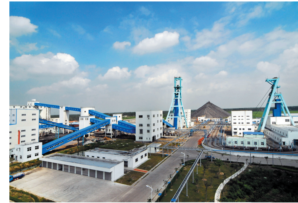
刘店煤矿