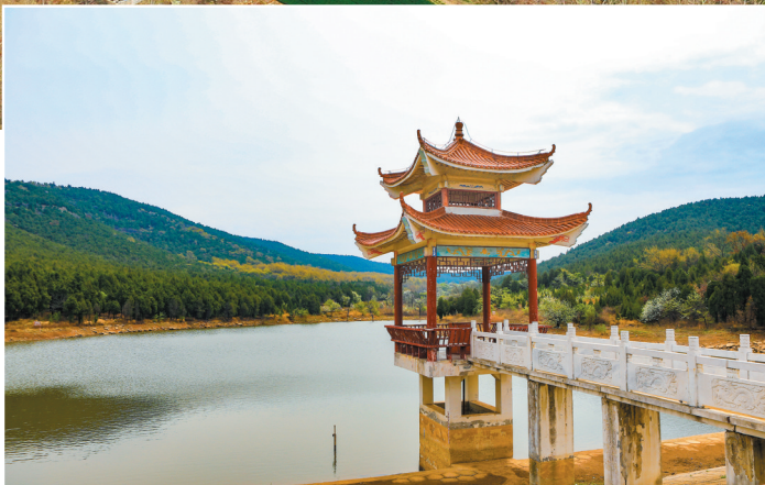
龙吟湖春色。

近年来,烈山区深挖旅游资源本土文化内涵,加快乡村近郊游、山水生态游等特色旅游业发展,围绕四季榴园4A级景区提升、新建榴园高档民宿和四眼井纪念馆,不断推进石榴特色小镇等重点项目建设,同步完善旅游