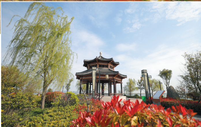
花红柳绿南湖美。