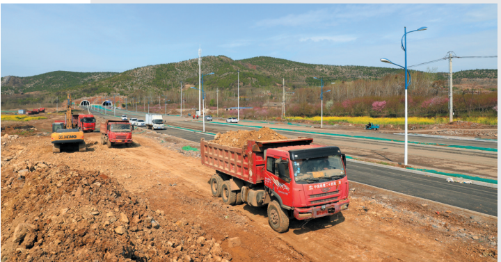
创新大道东段暨泉山隧道工程项目加快建设。