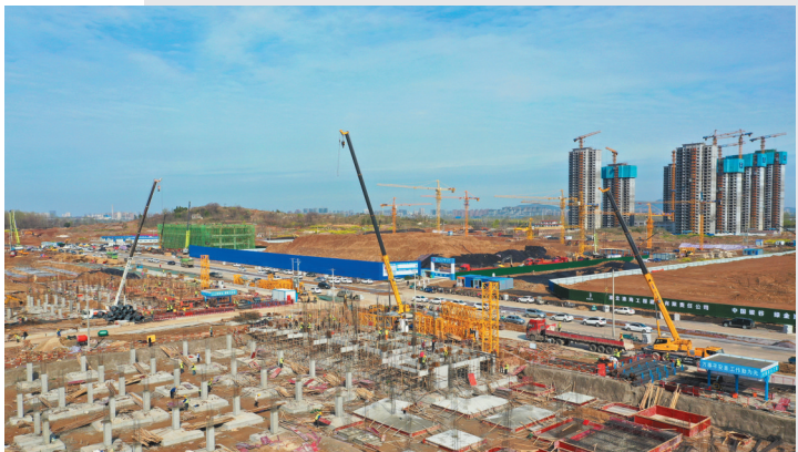
教育小镇建设现场如火如荼。