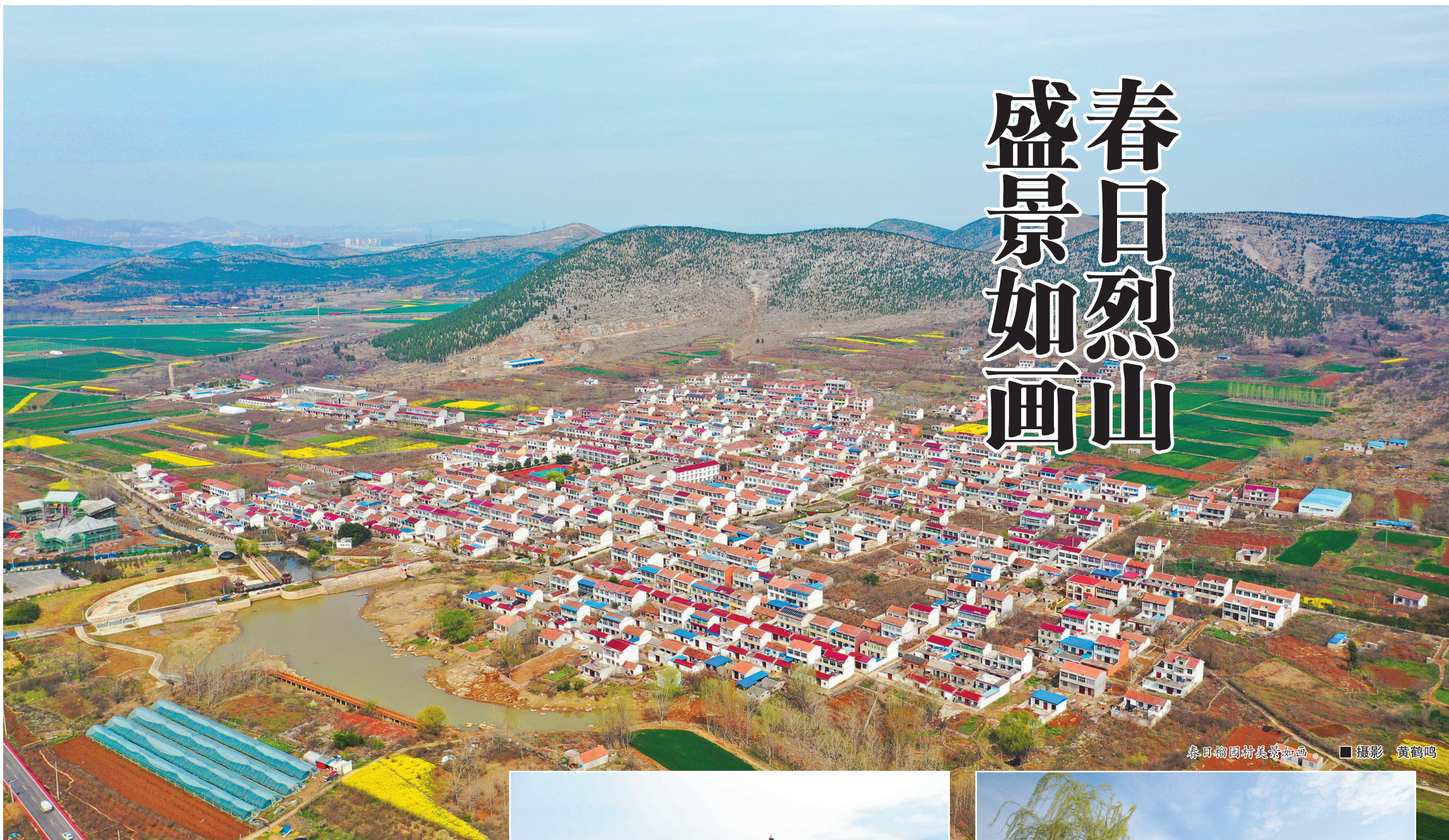
春日榴园村美景如画。