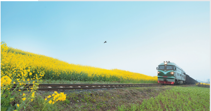
开往春天的列车。