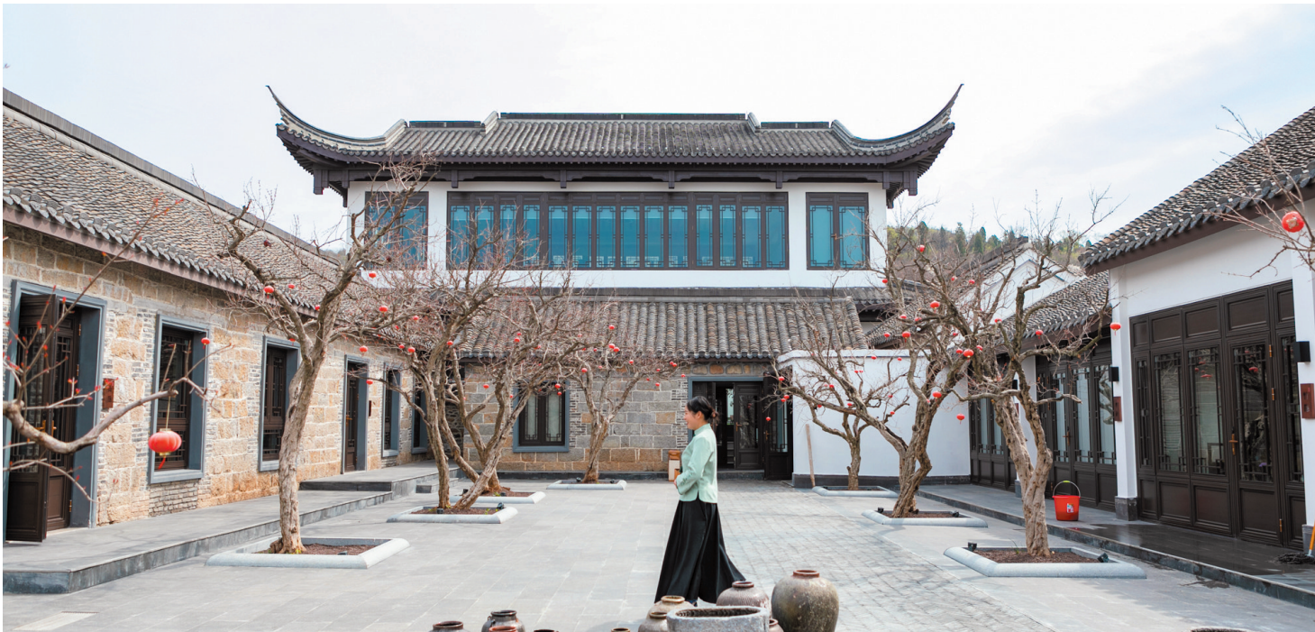
淮北市首家精品民宿项目亮相四季榴园景区。