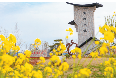
春意盎然的石榴小镇。