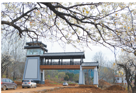
龙脊山景区改造雏形初现。