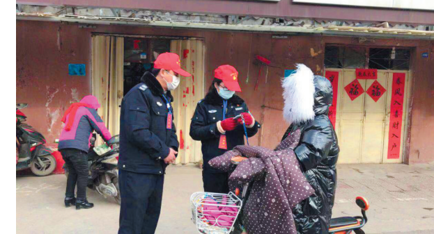
司法干警筑牢疫情防控的“铁篱笆”。

安全管理,建立疫情防控工作领导小组,全方位做好本系统复工准备。按照全市新冠肺炎疫情疫情防控工作安排,自1月27日以来,市司法局组织局机关人员对600多个经武汉来淮北人员的情况进行电话核查,确认外地来淮人员身体状况,做好信息统计上报。复工前夕,及时制定防疫工作制度,要求所有办公人员和来访人员进入办公场所必须佩戴口罩,进行体温监测。严格执行每日防疫消毒要求,积极调配口罩、消毒液、洗手液、防护药品等物资,做实做细防控工作,确保管辖区域无疫情、人员队伍无疫情。