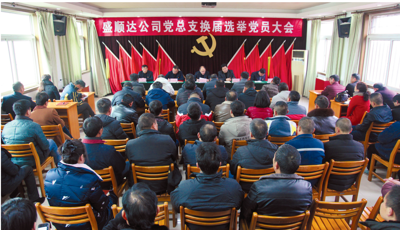
盛顺达公司党总支换届选举党员大会