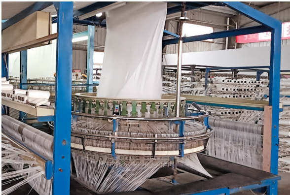
腾岭空编公司复工场景。