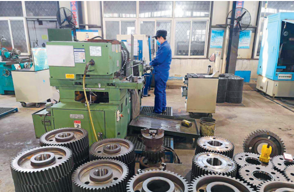
祁南公司磨齿车间进行磨齿作业。