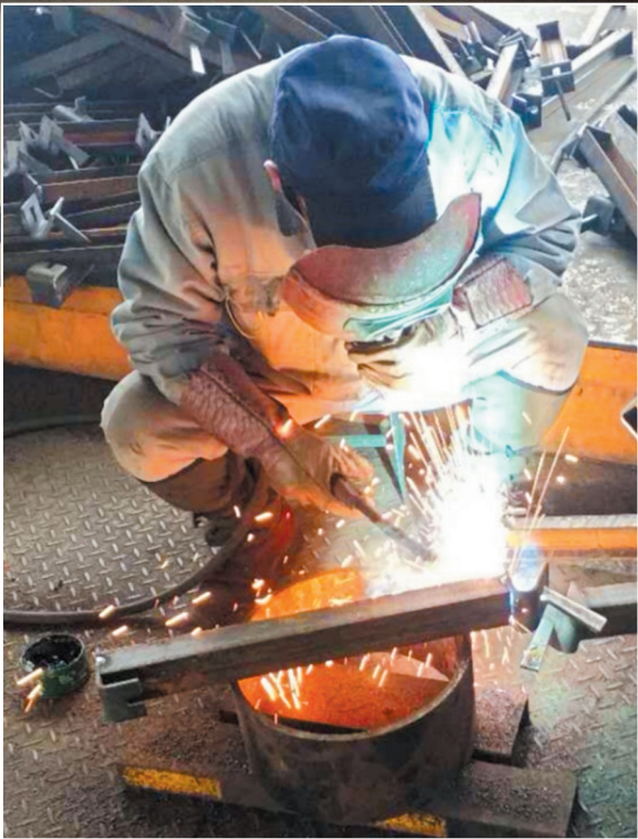
新图公司设备制造厂职工赶制准矿订单。