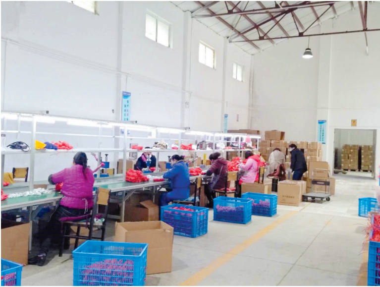
阳光机电公司电线车间生产电子数码雷管脚线。

淮海实业集团下属各基层单位,根据集团公司的决策部署,按照科学、合理、适度、管用的原则制定了适合本单位实际的针对性方案和措施,切实做好人员车辆出入登记、落实体温监