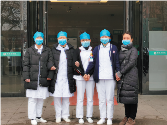
随时准备奔赴武汉的5名护理人员。