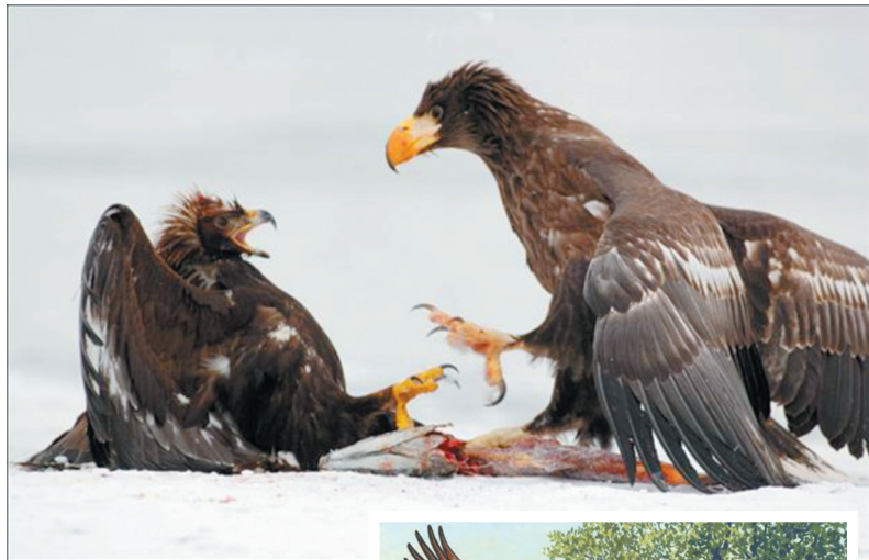
金雕(左)和虎头海雕(右)体型对比

借助风力和自身的加速度升空。相关测试认为，虽然阿根廷巨鹰的双腿结实有力，可以在瞬间将速度提高到每小时30公里，但依然需要直径100米的上升气流以及10度的坡度才能飞起来。在长距离飞行中，它们也可以不抖动翅膀，只靠空气滑翔。需要着陆的时候，阿根廷巨鹰则会首先将双脚伸平，展开双翅，这时候它们又变成了降落伞。