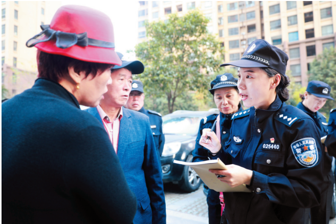
治安乱点大型统一清查行动。

不少视频监控探头和屯警点,这些能“清楚”掌握辖区公共道路和区域情况的探头和屯警点宛如一张“防护网”,为淮北社会治安稳定、百姓安居乐业保驾护航。