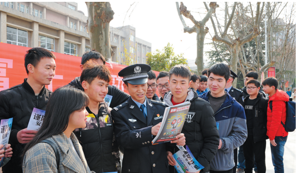
大学校园防电信诈骗宣传。