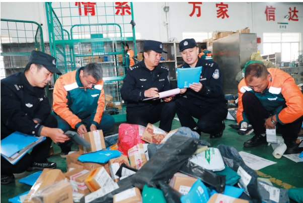
民警检查快递企业服务“双11”网购节。

以深化“五个公安”为龙头,市公安局坚持政治建警从严治警,全力以赴投入“践行新使命、忠诚保大庆”实践活动,高标准、高质量开展“不忘初心、牢记使命”主题教育,着力