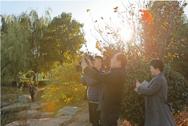
媒体及嘉宾代表团在南湖湿地公园拍摄美景。