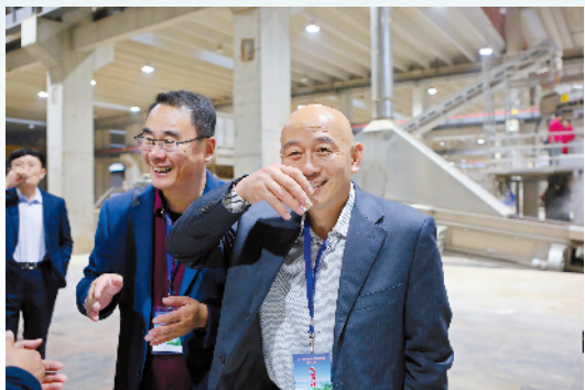
媒体及嘉宾代表团品尝口子美酒。