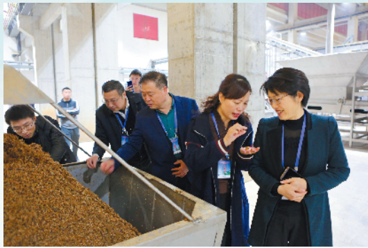
媒体及嘉宾代表团参观东山口产业园。