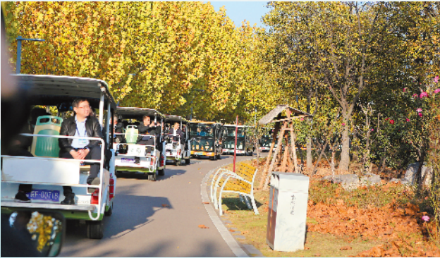
媒体及嘉宾代表团乘车参观南湖湿地公园。

当你疲劳时,抬眼便是绿色;当你游玩时,身边就有公园;骑行十分钟,就能见到湿地鱼鸟;驱车半小时,各类瓜果抬手可摘……这里是淮北,山丘绵延,河湖澜起,吸引着四面八方的朋友们来此感受“绿金淮北”“生态美城”的魅力。