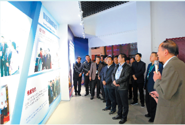
代表团在相邦科技了解新材料的相关知识。