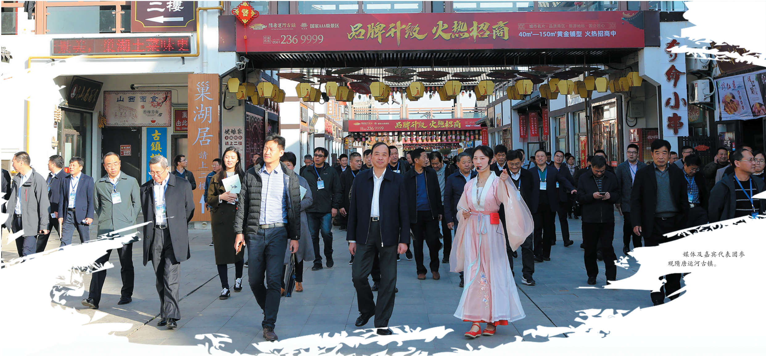
媒体及嘉宾代表团参观隋唐运河古镇。