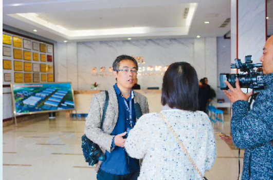
媒体代表接受我市传媒中心记者采访。

2019年,淮海经济区新一轮协同发展的帷幕在淮北开启;2019年,新时代全媒体协作共进在淮北谱写新篇。各地媒体人正携手合作,为宣传淮海大地高质量发展新成就勠力同心、不懈奋斗。