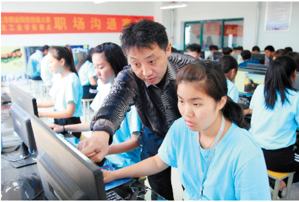
信息工程系老师在辅导学生。