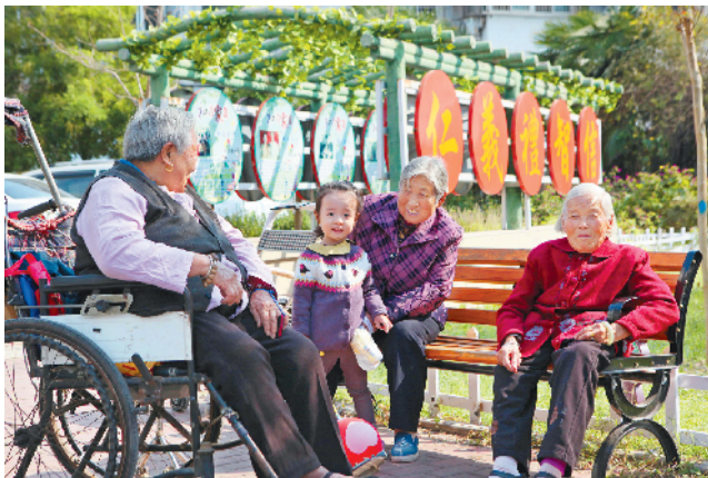
水清木华小区居民在改造后的广场上享受休闲时光。

达到企业入驻条件的小区,按照相关程序选聘物业服务企业进驻管理;暂不符合企业进驻的小区,改造后移交至街道、社区,建立社区物业服务中心,为改造后的小区提供基本的保洁、保安、保绿服务,形成常态化的管理机制,巩固老旧小区整治改造成果,确保老旧小区“旧有所改、改有所养”。