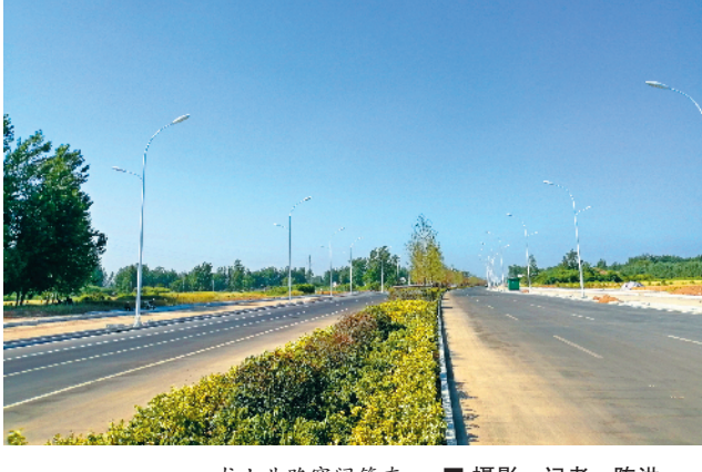
龙山北路宽阔笔直。