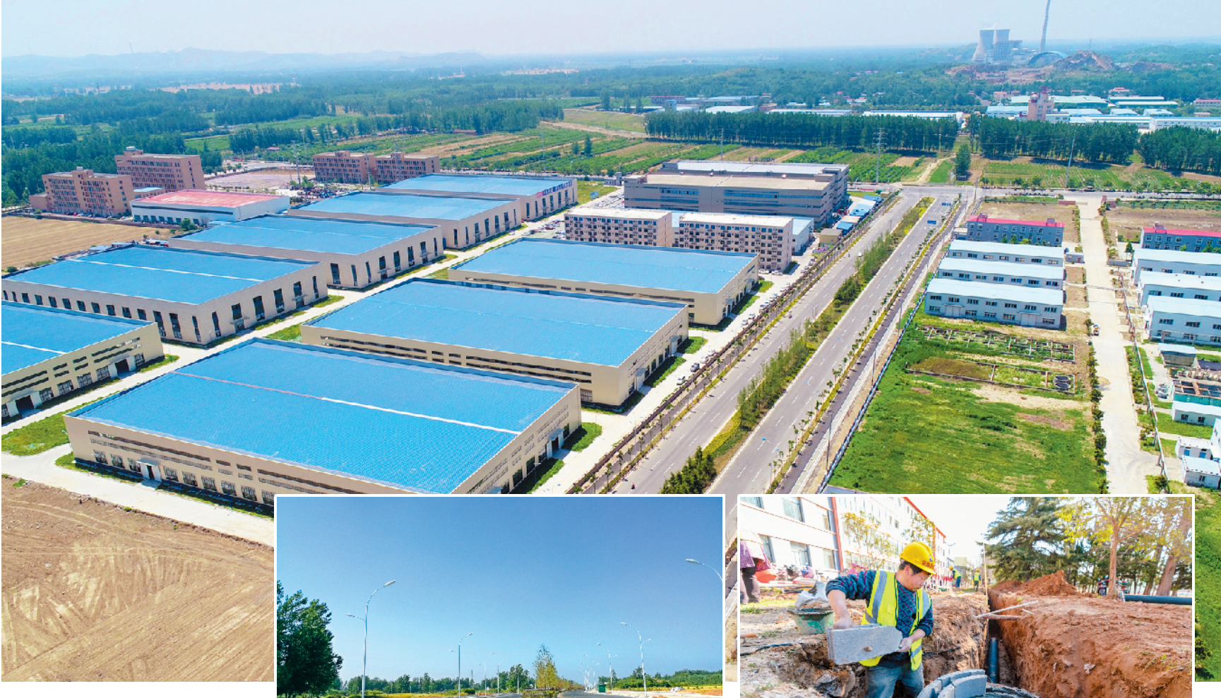
东部新城建设加快推进。