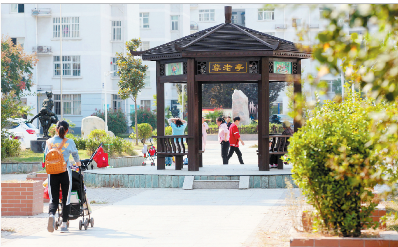
滨河花园一期环境美。