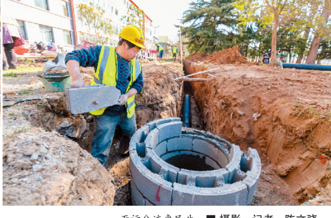
雨污分流惠民生。

目建设,我市着力完善项目推进机制,继续推行市级领导联系重大项目的做法,坚持要素跟着项目走,重点向“九个一工程”等重大项目倾斜,不断提高项目开工率、竣工率、达产率和转化率。在科学施工方面,通过倒排工期,优化工作流程,科学