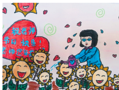
淮海路小学小记者 杨梓轩 指导老师：何爱梅