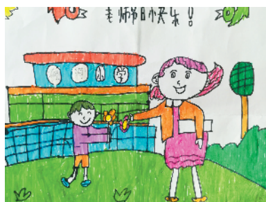
淮海路小学小记者 杨博超 指导老师：张敏