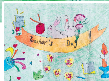
淮海路小学小记者 徐天玥 指导老师：张敏