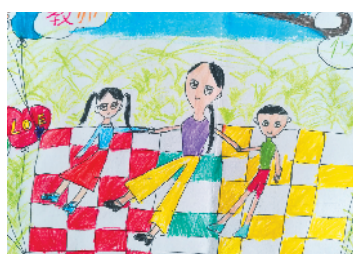
淮海路小学小记者 许森森 指导老师：郜业玲