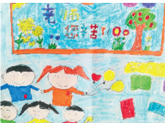
淮海路小学小记者 刘娅楠 指导老师：徐华