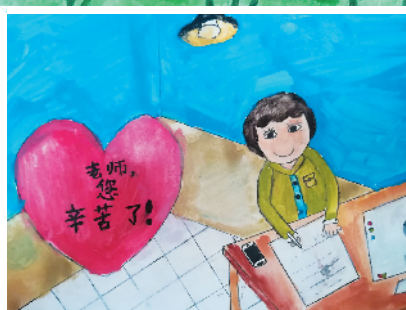
淮海路小学小记者 蔡明佑 指导老师：何爱梅