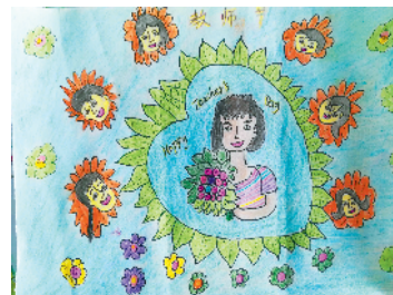
淮海路小学小记者 张婧秋 指导老师：郜业玲