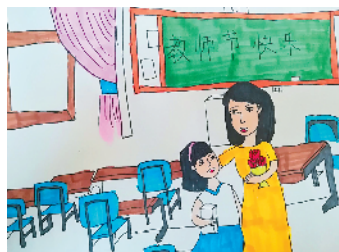
淮海路小学小记者 刘欣悦 指导老师：何爱梅