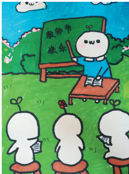
淮海路小学小记者 蔡雨阳 指导老师：何爱梅