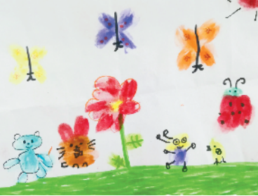
淮海路小学小记者 张雨萌 指导老师:丁惠萍