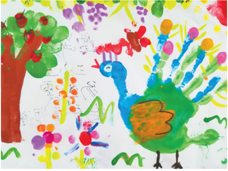
淮海路小学小记者 汤涵雯 指导老师:丁惠萍