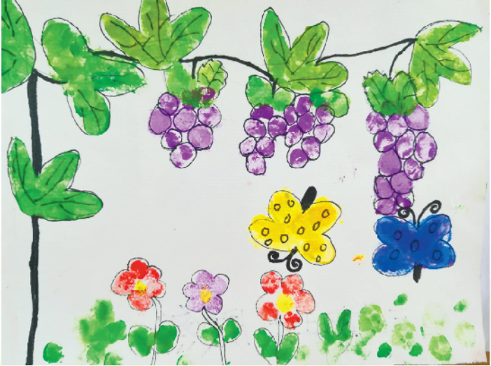
淮海路小学小记者 陈然 指导老师:徐华