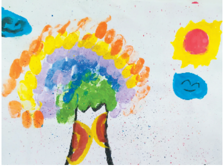
淮海路小学小记者 杨逸梵 指导老师:徐华