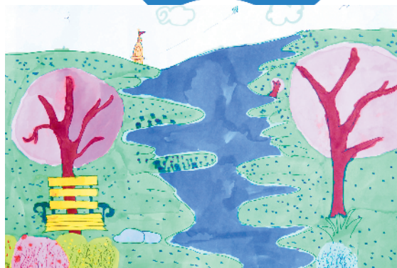
淮纺路小学小记者 陈鸿宇 指导老师:王颖