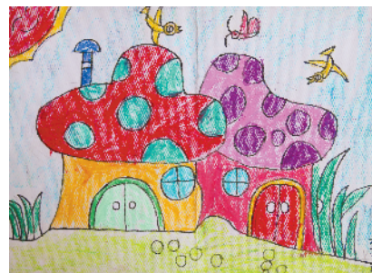
淮纺路小学小记者 杨羽轩 指导老师:张莉