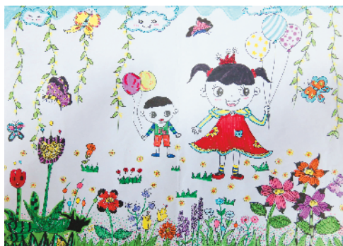
淮纺路小学小记者 徐诺一 指导老师:徐荣