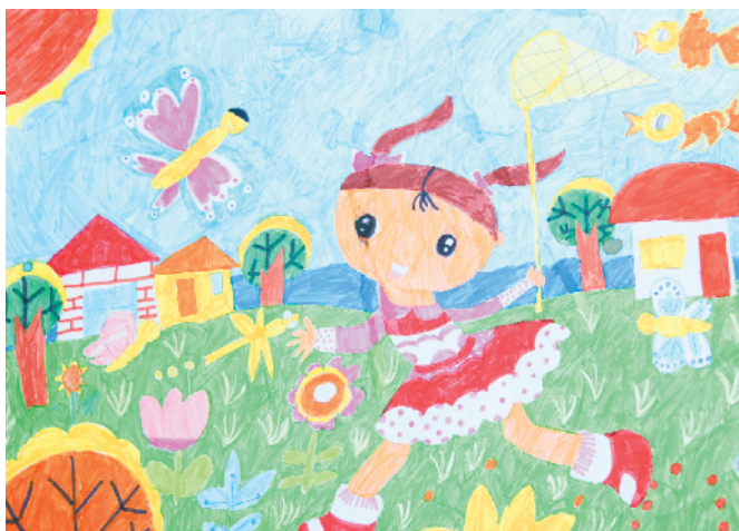
淮纺路小学小记者 居然然 指导老师:关磊