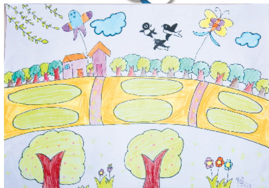
淮纺路小学小记者 曹逸 指导老师:朱荣