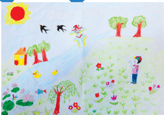
淮纺路小学小记者 白烁琪 指导老师:徐荣