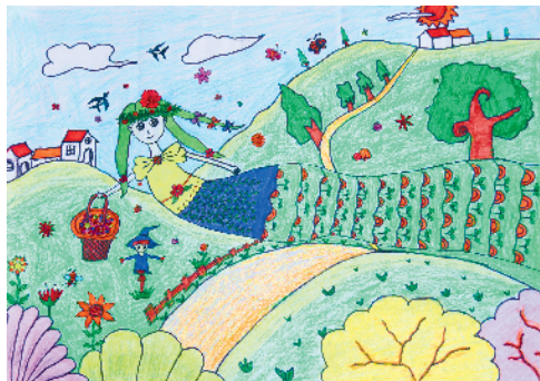
淮纺路小学小记者 陈俊宇 指导老师:朱学清