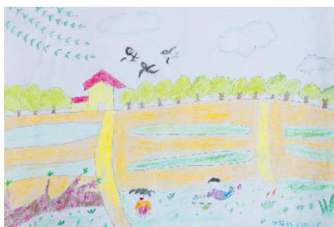
淮纺路小学小记者 张嫣然 指导老师:朱荣