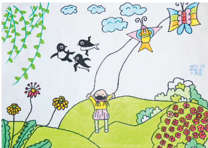
淮纺路小学小记者 杨曼妮 指导老师:王颖