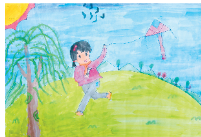
淮纺路小学小记者 丁浩宇 指导老师:朱学清