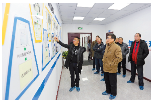
参观龙芯微科技有限公司