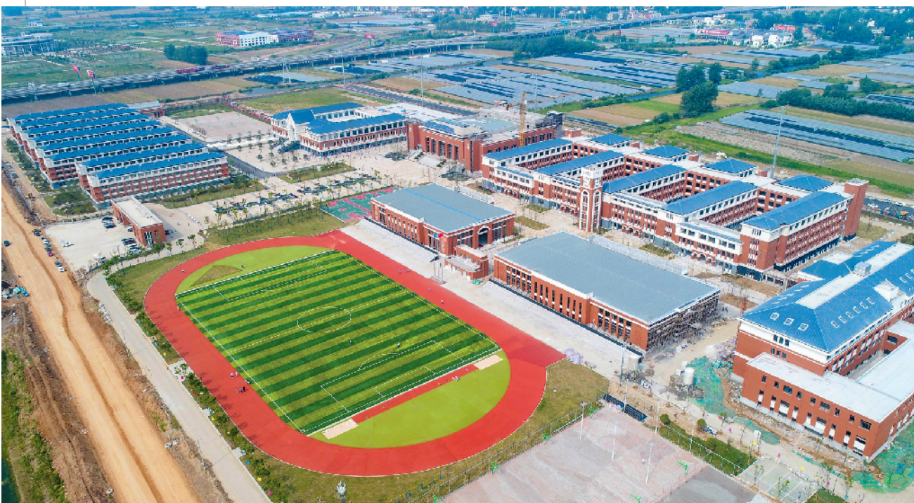
安徽师范大学附属郑蒲港学校