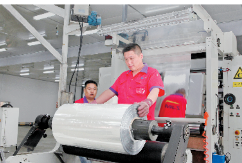
紫江集团紫江喷铝生产现场