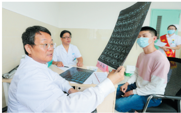
皖籍专家来濉溪义诊

在濉溪县经济社会发展的时代卷轴上，保障和改善民生，分明就是一条贯穿始终的经脉，无处不见它的生机与活力。老百姓“学有所教、劳有所得、病有所医、老有所养、住有所居”的夙愿，也一步步变成一个鲜活的场景和生动的画面。