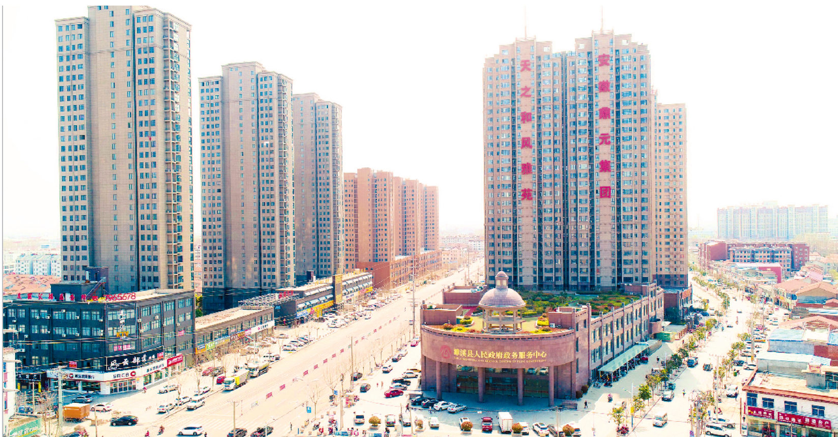
濉溪县城南俯瞰图

一条条大道纵贯横陈，一栋栋高楼拔地而起，一座座村落焕发生机……无论从哪个角度观察，濉溪，都在经历着一场前所未有的变革。