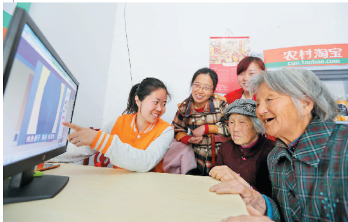
农村淘宝服务乡村百姓