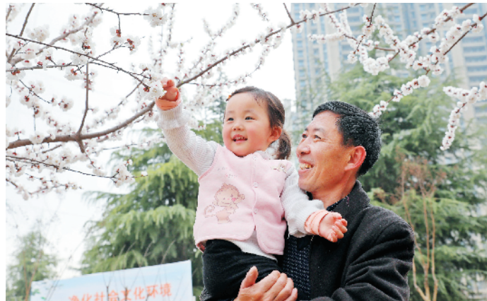
群众共享城乡建设成果

道路，犹如城市发展的大动脉，是推动地方经济发展的重要支撑。近年来，在县委、县政府高度重视下，全县道路建设取得长足发展，但随着城区逐步向南拓展以及相融一体化发展的需要，城区部分道路需要加宽、整修等全面升级改造。