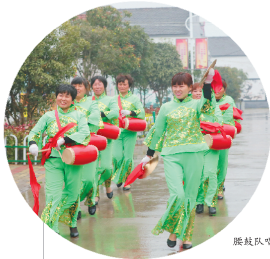
腰鼓队唱响乡村新变化

如今的濉城，已经历了化蛹成蝶的惊人嬗变，正沐浴着时代的春风翩翩起舞。明日的濉城，这座生态秀美、功能完善、宜业宜居的现代新城将成为濉水岸边耀眼的明珠。