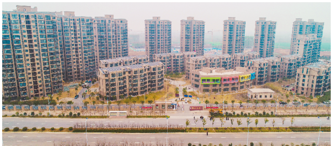
濉苑星城一期安置小区